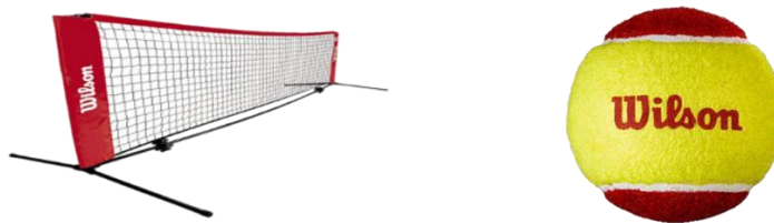
Figure 7 - Filet autoportant (minimum 5,5 mètres) et balle "Stage 3 feutrée" (9cm de diamètre)